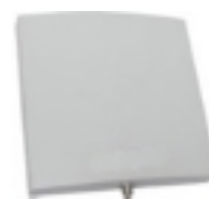
Esempio di antenna da pannello