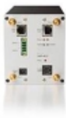
Esempio di Access Point da quadro