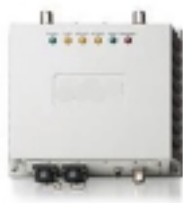
Esempio di Access Point da pannello

Quando si valuta un impianto wireless in ambiente industriale occorre tenere presente le diverse dimensioni degli impianti, i materiali da costruzione, la distanza tra i punti di trasmissione, gli ostacoli fisici e le eventuali interferenze.